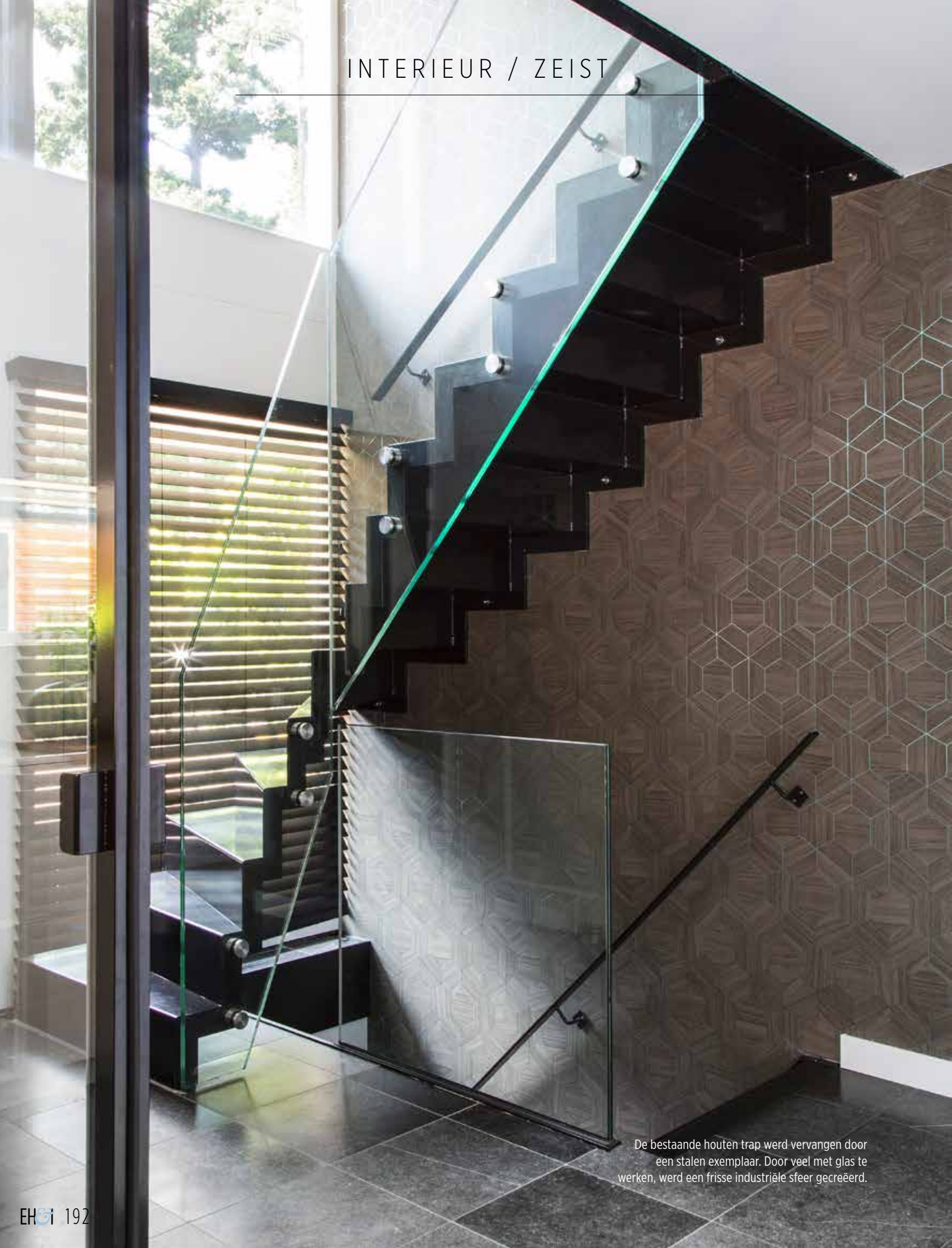
De bestaande houten trap werd vervangen door een stalen exemplaar. Door veel met glas te werken, werd een frisse industriële sfeer gecreëerd.