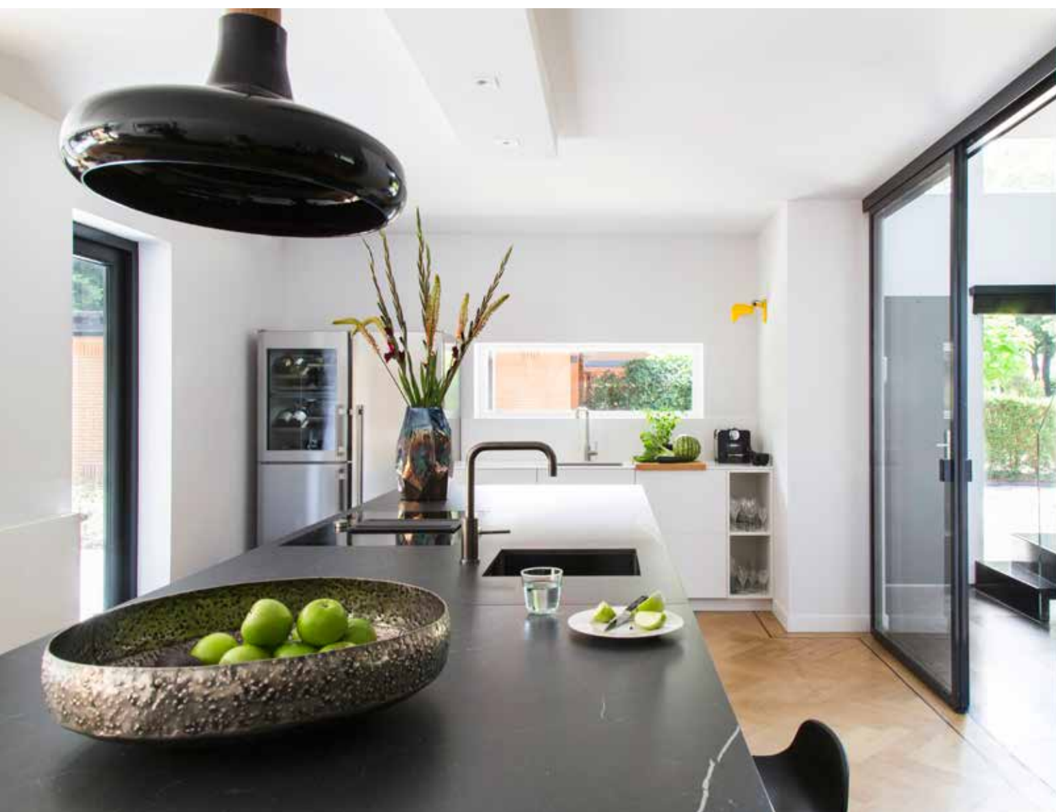
Naast het zwarte kookeiland staat een witte kastenwand met ijskast, vriezer, vaatwasser en een extra gootsteen. De schuifpui leidt naar de hal. RECHTS Eetkamerstoel Mara is een ontwerp van Christian Werner voor Leolux. Het (verlichte) kunststof object is van Adelbert Gans.