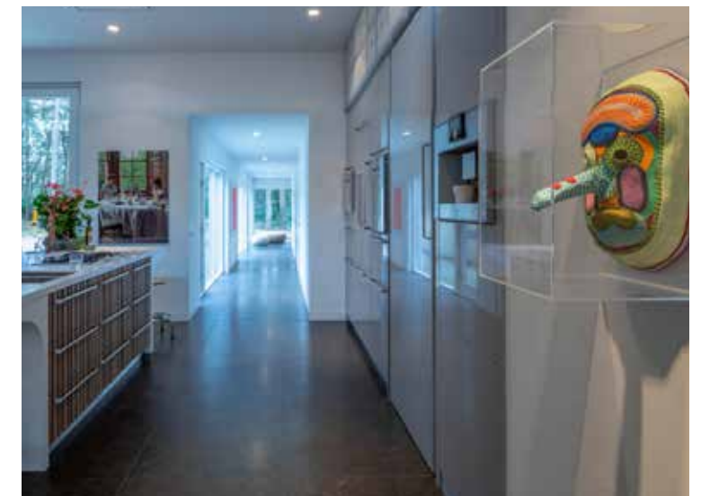
Het doorkijkje naar de vleugel van de kinderen