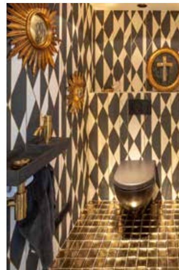
'Het blinkende toilet'

De verrassingen 'In de vleugel van de kinderen wilde ik een badkamer maken die ze zich altijd zouden herinneren. Hij is