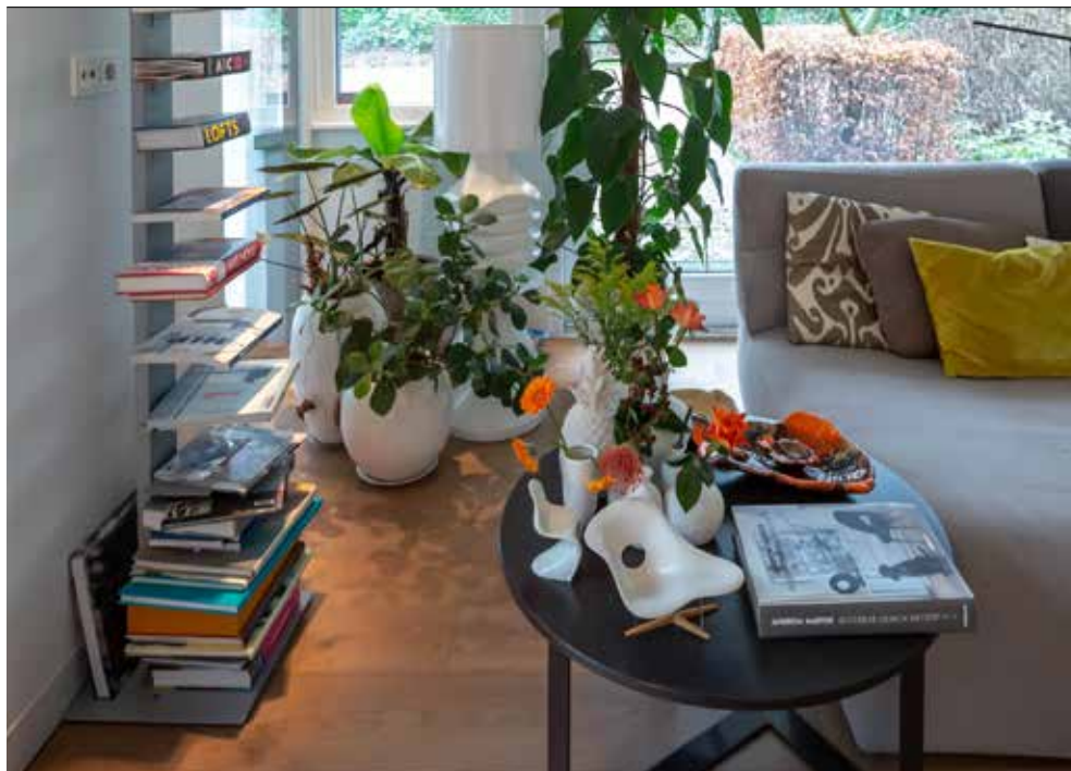
'Ik ben dol op planten, dat maakt de boel levendig'

extra ramen in laten zetten, het dak opgehoogd en er een vleugel aangebouwd. Heel rigoureuus allemaal, ja. Maar doordat we in die tijd in een container in de tuin woonden, en ik dus altijd beschikbaar was om met de aannemer te overleggen, duurde het toch maar een maand of drie.'