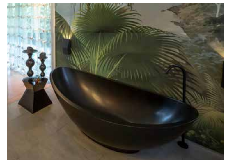
Met kan op 2 manieren in bad zitten, of met uitzicht naar buiten, of met zicht op de tv